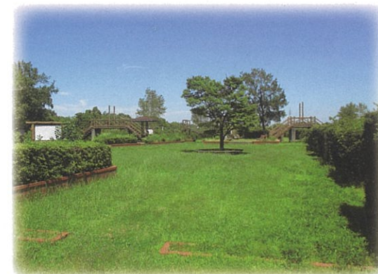
富浜緑地 運動施設・レクリエーション施設