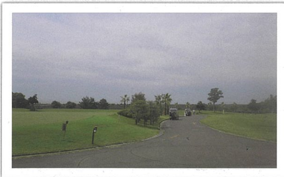
名古屋港ゴルフ倶楽部（富浜コース）