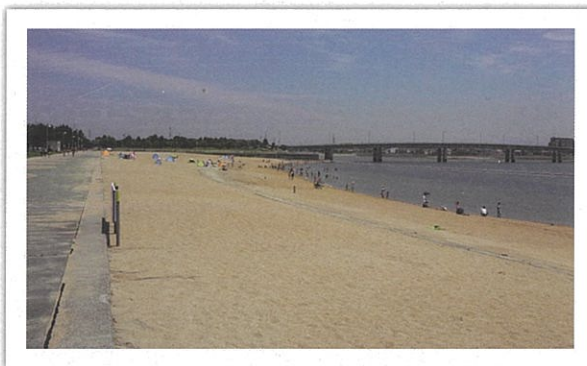
新舞子マリンパーク ブルーサンビーチ