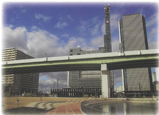
チャンネルパークささしま 堀止緑地